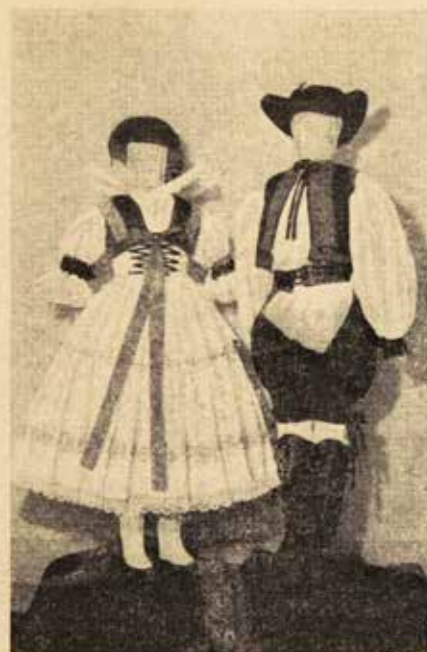
Hanácké kroje ve sbírkách VSM.

Ať lásky a úcty ke kulturnímu odkazu předků jsou výrazem uvědomělé českosti, neboť vedou k vytváření duchovního pojítka s národní tradicí - pokrokem minulosti, jehož rozvíjení spěje k pokroku národa v budoucnosti.