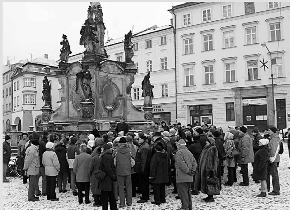
Novoroční vycházka členů Vlastivědné společnosti muzejní v Olomouci v roce 2009 (archiv VSMO).