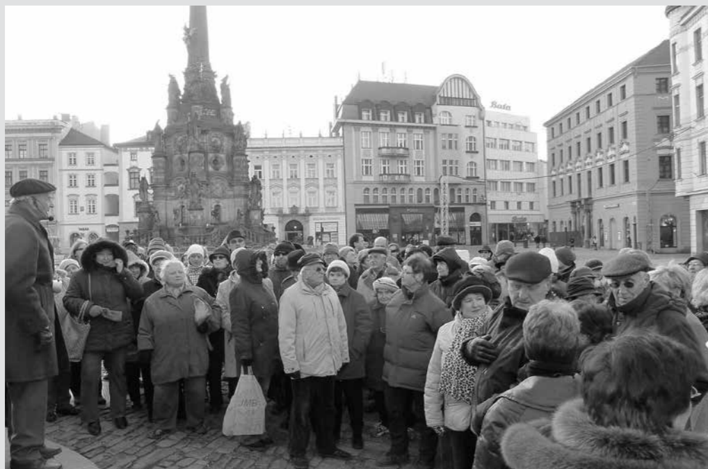
Novoroční vycházka členů Vlastivědné společnosti muzejní v Olomouci v roce 2013.