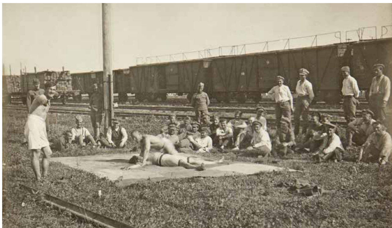
Dvě z fotografií původního muzea Národního osvobození, jež při likvidaci expozice v roce 1940 unikly pozornosti. Zachycují okamžiky ze života legionářů v Rusku.

výborem v Olomouci, o jejím dlouhodobém ponechání pro muzejní účely. 440 V následujících měsících jednání pokračovala a došlo dokonce k dohodě o vytvoření společného kuratoria; čáru přes rozpočet těmto plánům udělal únorový převrat roku 1948. Obchodní a živnostenské komory totiž byly v jeho důsledku zrušeny. Pro Vlastenecké muzeum to byl počátek konce.